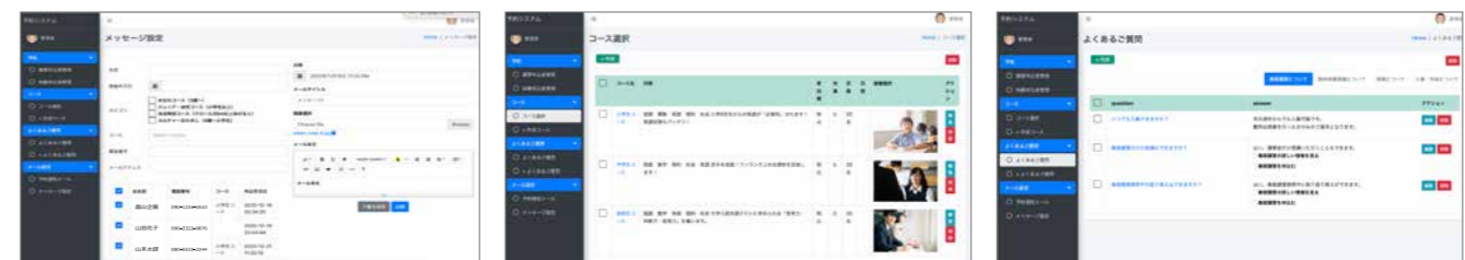
●顧客用メッセージ設定